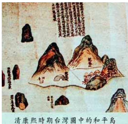
清康熙時期台灣圖中的和平島

和平島在清朝前期【康熙雍正年間】的時候，稱為〔雞籠嶼〕或〔大雞籠嶼〕，在 1870 年代時，為了要與東北方海上的〔小雞籠嶼〕〔即今日基隆嶼〕區隔，以免混淆，於是改名社寮嶼(島)，社：是指凱達格蘭族〔大雞籠社〕，寮：是指漢人搭建的魚寮。光復之後，社寮島改名為和平島，據說二二八事件時，國軍在此處槍決基隆受捕民眾，曾使當地海面上遍滿浮屍，令人驚懼，遂改名為和平島祈求永久和平之意！